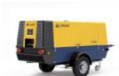
Compresor para colocación airbags