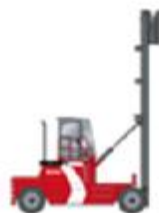
Apilador vertical de contenedores Empty container handler