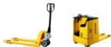
Transpallet manual y eléctrico