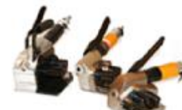
Tensoras para banda de poliéster