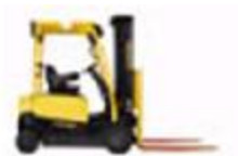
Carretilla elevadora ligera