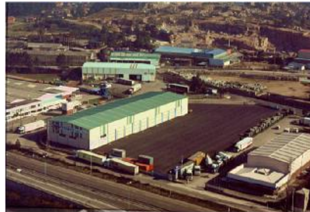
Instalaciones Porriño Ctra. Porriño-Salceda Km 0.2 36400 A GRANXA - PORRIÑO

Superficie cubierta: 1.500 m 2 Superficie exterior: 1.000 m 2